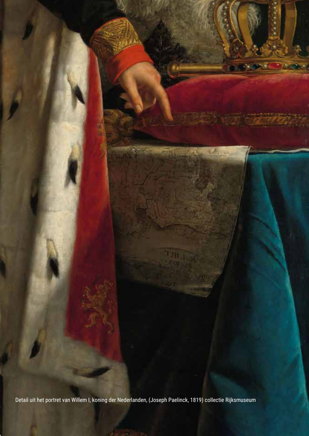
Detail uit het portret van Willem I, koning der Nederlanden, (Joseph Paelinck, 1819) collectie Rijksmuseum